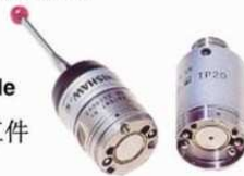
各模块的测针建议使用长度如下: