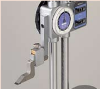
简单安全的锁紧装置